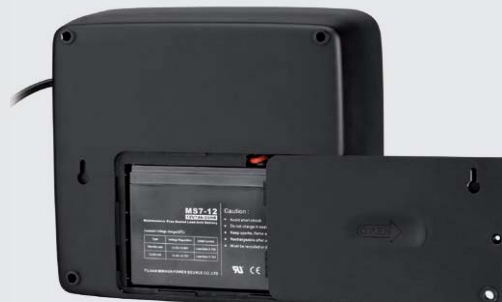
Snadná výměna baterie