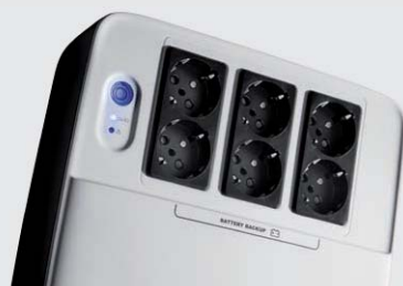
Uživatelsky přívětivá signalizace a indikace