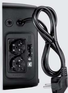
Možnost zásuvek různých standardů